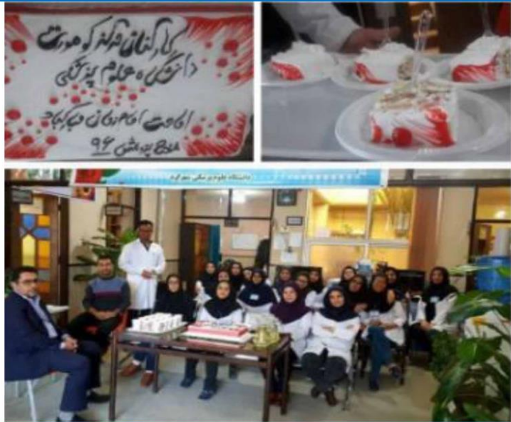
سیاس فراوان از حمایت کنندگان طرح: معاونت تحقیقات و فناوری وزارت بهداشت، درمان و آموزش پزشکی، معاونت تحقیقات و فناوری دانشگاه علوم پزشکی شهرکرد، پژوهشکده گوارش و کبد دانشگاه علوم پزشکی تهران