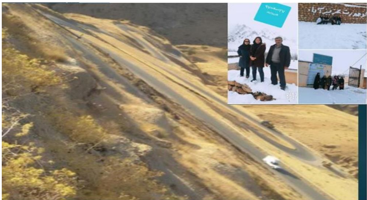
عکس: مسیر دسترسی به خوشه کوهورت روستایی در روستاهای بخش مرکزی در شهرستان اردل و پیچ های سریالایی جاده اردل به دوازده امام در روز آفتابی و روستای عزیزآباد در روز برفی و پرسنگران کوهورت در تصویر مشاهده می شوند. فاصله تا مرکز استان بیش از ۳۰۰ کیلومتر رفت و برگشت.